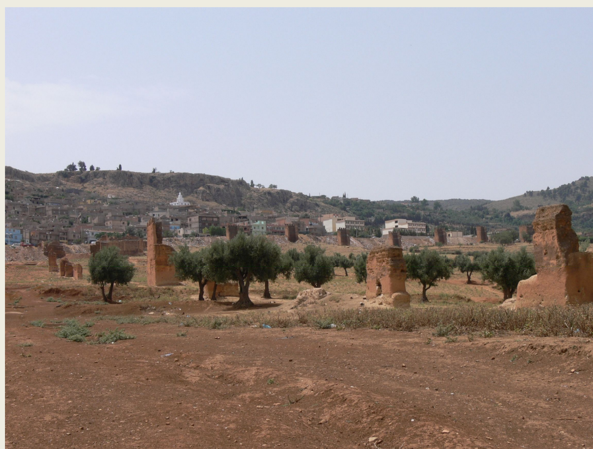
Enceinte en 2009 (à gauche) et en 2016 (à droite)